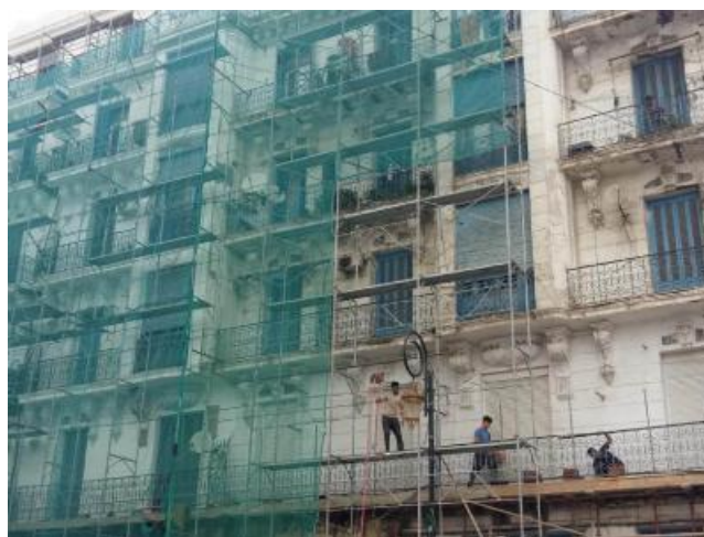
Alger, Algérie, 2019.