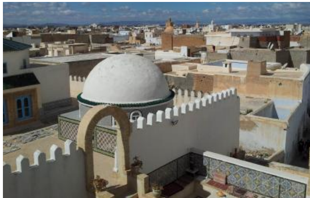
Medina de Keirouan, Tunisie, 2014.